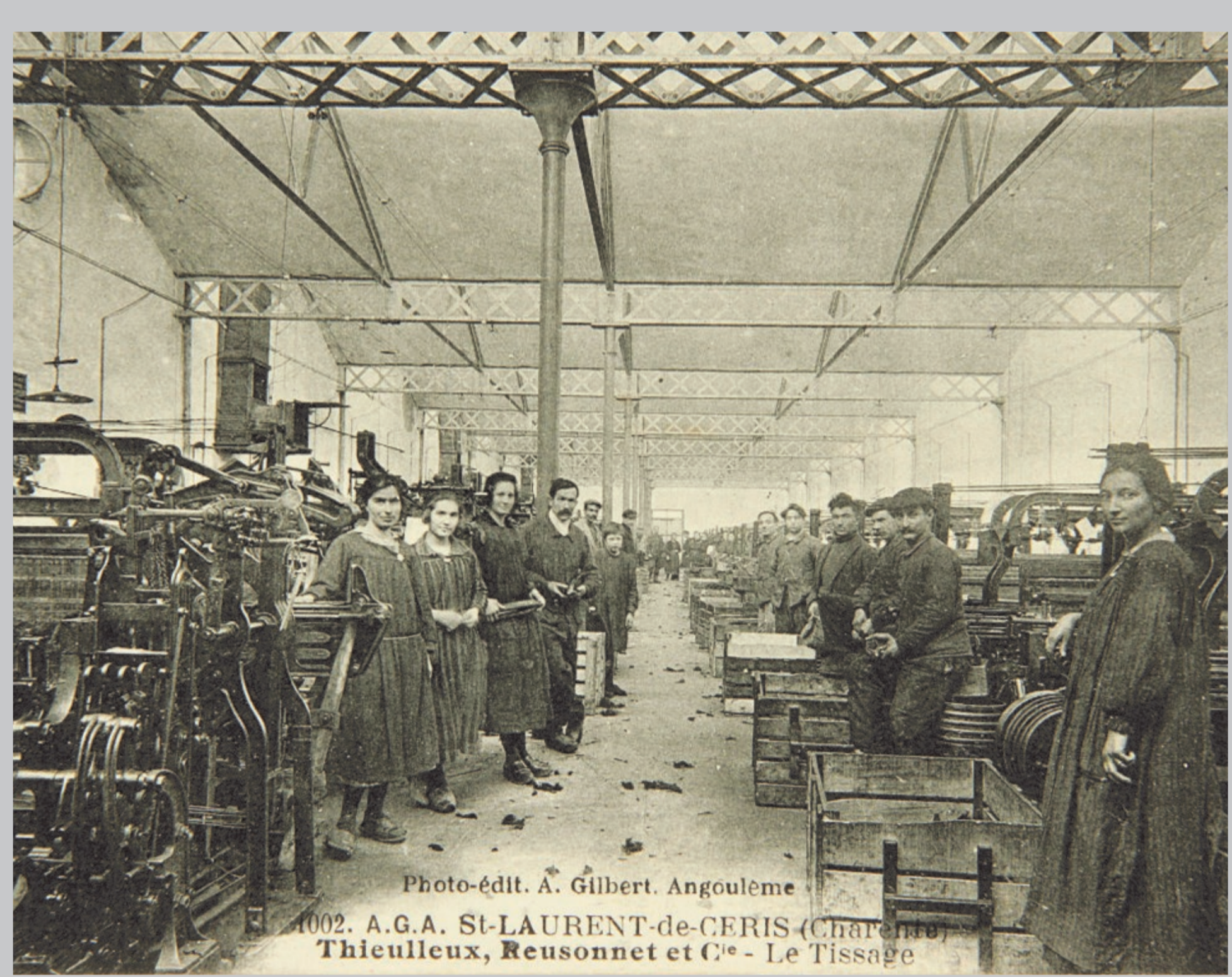
Photo-édit. A. Gilbert. Angoulême 1002. A.G.A. St-LAURENT-de-CERIS (Charente) Thiculleux, Reussonnet et C ie - Le Tissage

infirmières qui ont soigné les soldats blessés dans les hôpitaux de guerre et les maisons de convalescence, ou