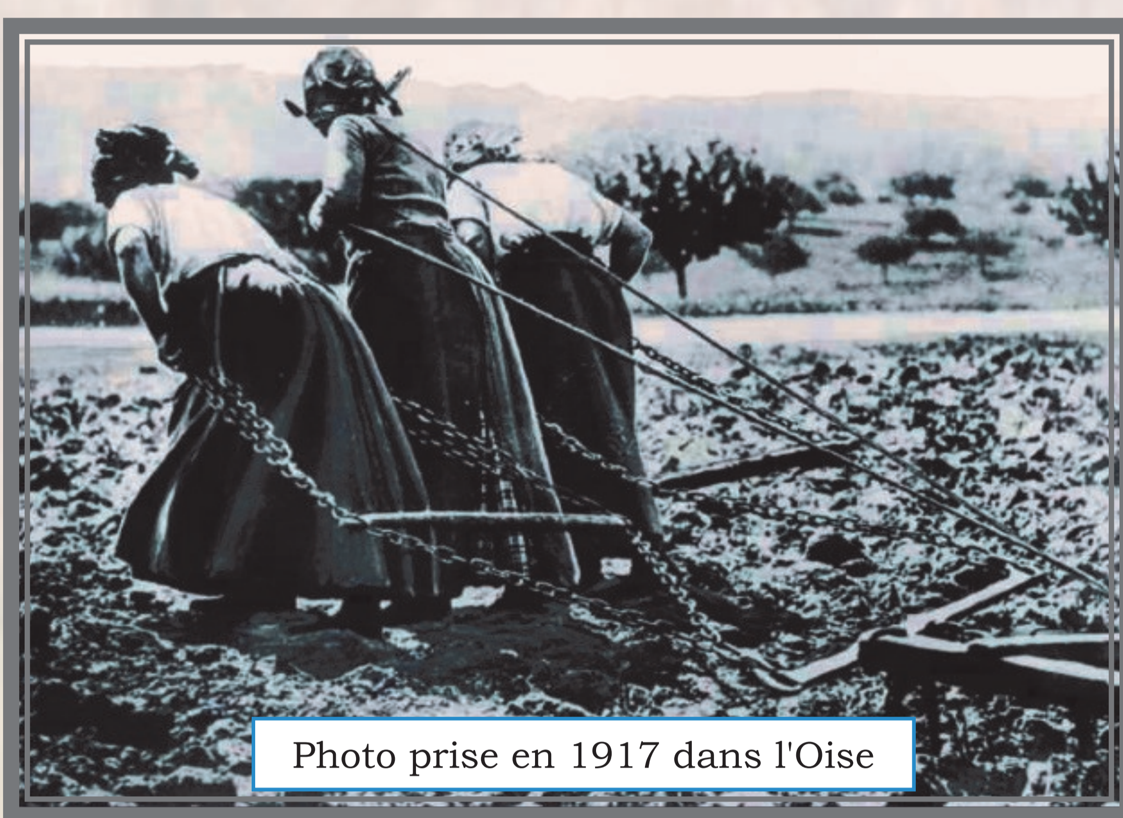
Photo prise en 1917 dans l'Oise

Les femmes charentaises ont dû très vite remplacer les hommes partis au front. Cette contribution a revêtu des formes multiples : femmes d'agriculteurs qui ont dû assumer à partir de l'été 1914 les travaux des champs rendus d'autant plus difficiles que les animaux de trait étaient réquisitionnés ;